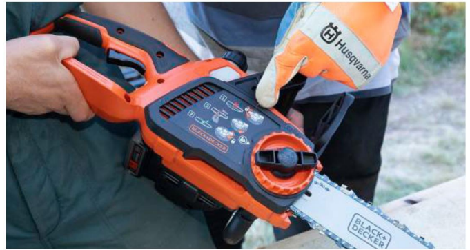
+ ANSCHAUlich: Bei Black & Decker wird direkt auf dem Kettenkasten erklärt, wie die Kette richtig gespannt wird.