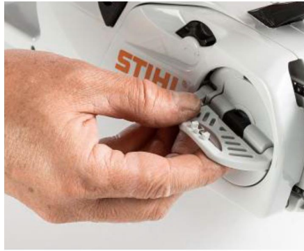
+ PRAKTISCH: Die Kettenwartung erfolgt stets werkzeuglos – hier bei Stihl.