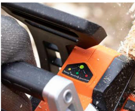
+ WARNUNG: Bei Yardforce gibt es eine Überlastungs-Anzeige für den Motor.