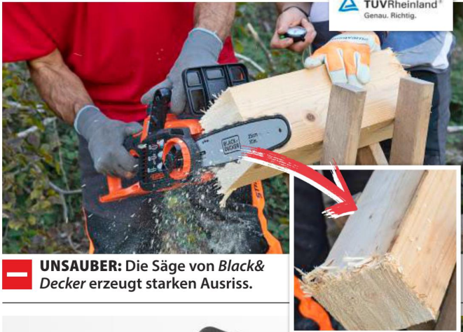
- UNSAUBER: Die Säge von Black & Decker erzeugt starken Ausriss.