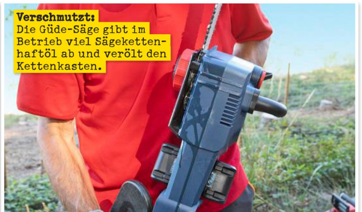
Verschmutzt: Die Güde-Säge gibt im Betrieb viel Sägekettenhaftöl ab und verölt den Kettenkasten.

221002230402P4 am 07.10.2022 über http://www.united-kiosk.de