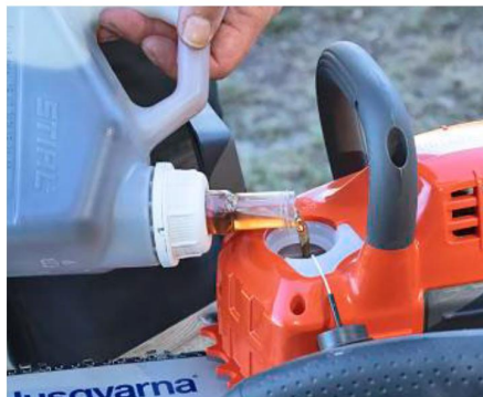
+ BEQUEM: Bei Husqvarna ist das Sägekettenöl komfortabel nachfüllbar.