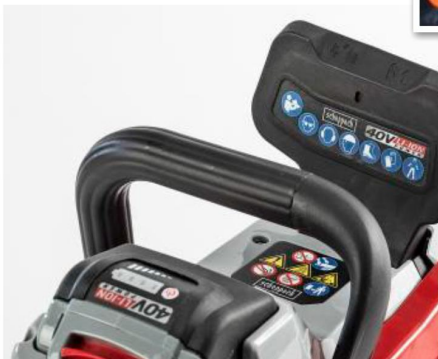
+ DEUTlich: Bei Scheppach sind Sicherheits-Piktogramme gut erkennbar.