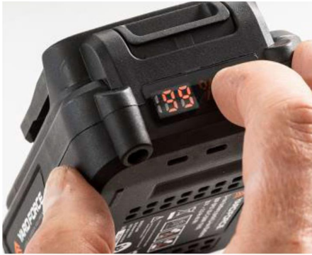
+ EXAKT: Bei Yardforce wird am Akku die Restladung in Prozent angezeigt.