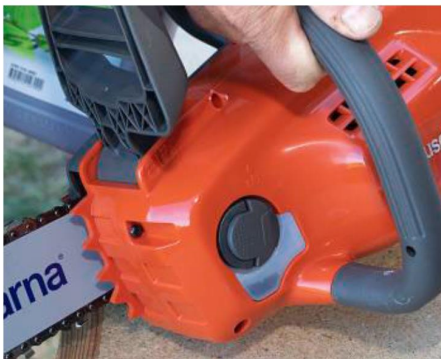
+ ANZEIGE: Der Füllstand des Sägekettenöls ist bei Husqvarna gut sichtbar.