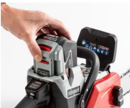
+ EINFACH: Der Akkutauch (hier bei Scheppach) fällt stets leicht.