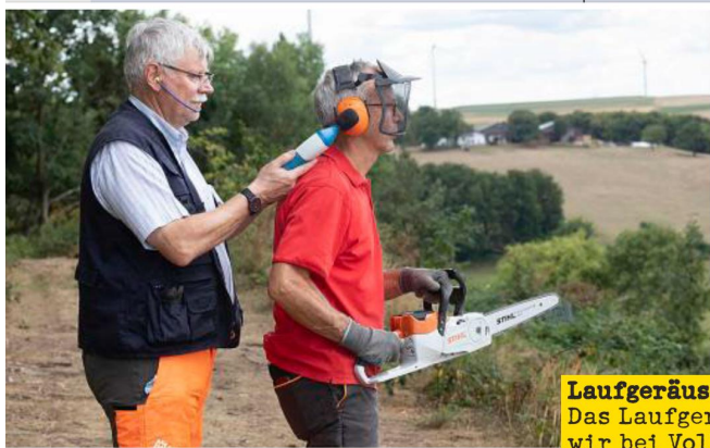
Laufgeräusch: Das Laufgeräusch haben wir bei Vollgas am Ohr des Benutzers ermittelt.

Sicherheit: Den Sicherheits-Check nahm für uns der TÜV Rheinland entsprechend Normvorgaben und dem Stand der Technik vor. Auch wenn die Maschinen sicher funktionieren – tragen Sie unbedingt geeignete Schutzkleidung mit Schnittschutzeinlage!