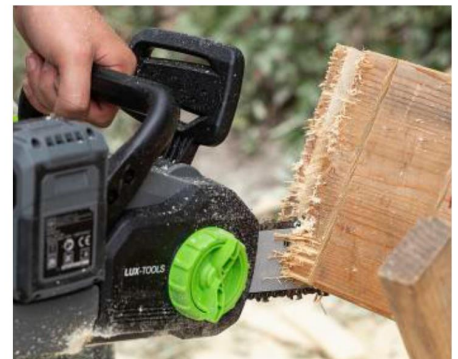
- RUPPIG: Die Säge von Lux-Tools sägt zwar schnell, aber recht unsauber.