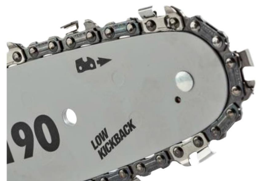
+ DEUTlich: Meist ist die Montagerichtung der Kette am Schwert erkennbar.