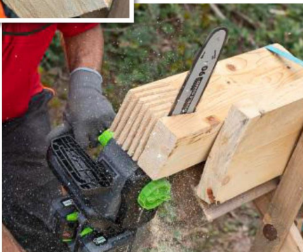
PRAXIS: Im Test haben wir Schnitte auch längs zur Faserrichtung beurteilt.