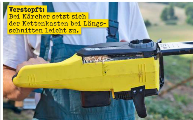
Verstopft: Bei Kärcher setzt sich der Kettenkasten bei Längsschnitten leicht zu.